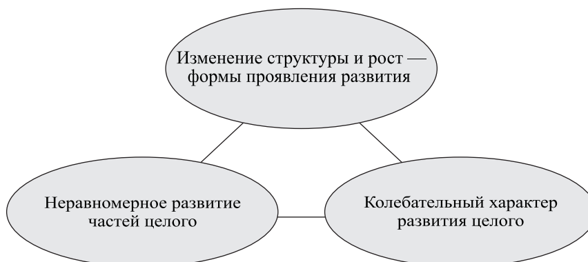
Рис. 1. Изменение структуры и рост как формы проявления развития

В предлагаемой концепции понятие «развитие» основывается на следующих моментах (рис. 1). Понятие развития соотносится с понятием роста как содержание и форма. При этом рост выступает в качестве одной из форм проявления развития. Другая его форма — изменение структуры системы. Далее, развитие всегда происходит неравномерно — таков закон неравномерности развития. При этом речь идет о неравномерности развития как частей целого, так и системы в целом. 9 Последнее представляет собой закон колебательного развития целого. Таким образом, развитие целого находит свое выражение в росте этого целого, в структурных изменениях, которые происходят внутри целого, а также в неравномерности роста как самого целого, так и его частей.