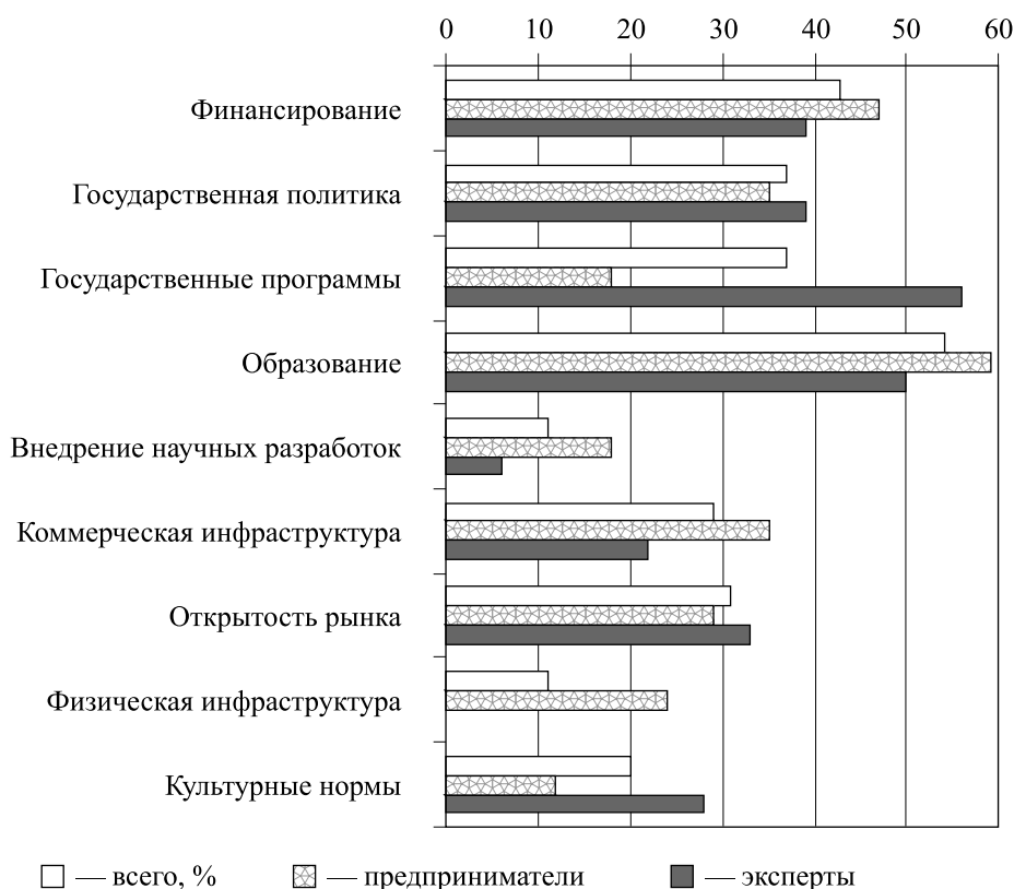
Рис. 3. Факторы, положительно влияющие на предпринимательство

При этом среди экспертов-«теоретиков», по сравнению с действующими предпринимателями чаще встречаются более позитивные оценки происходящего в плане содействия развитию предпринимательства на уровне объективных факторов. Профессионалы считают, что нет внешних факторов, сдерживающих развитие предпринимательства: в государстве созданы и развиваются все необходимые условия (льготное законодательство, возможности получения кредитов и др.), государство ориентировано на поддержку предпринимателей, работающих в соответствии с законодательством, и поддерживает предпринимателей, занимающихся производством и инновационной деятельностью.