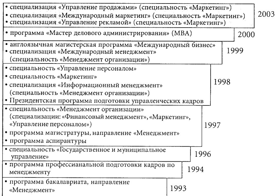
Рис. 2. Развитие образовательных программ

С другой стороны, преподаватели, успешно работающие на программах MBA и профессиональной переподготовки, несут в аудитории основных образовательных программ уникальные навыки и знания, отточенные в интерактивных занятиях с практиками бизнеса. Следует также отметить, что именно сочетание трех главных типов программ, характерных для ведущих школ бизнеса крупных государственных университетов США — бакалавриата, MBA и аспирантуры (в частных университетах развиваются лишь последние две), отвечает изначальному видению модели нашего факультета.